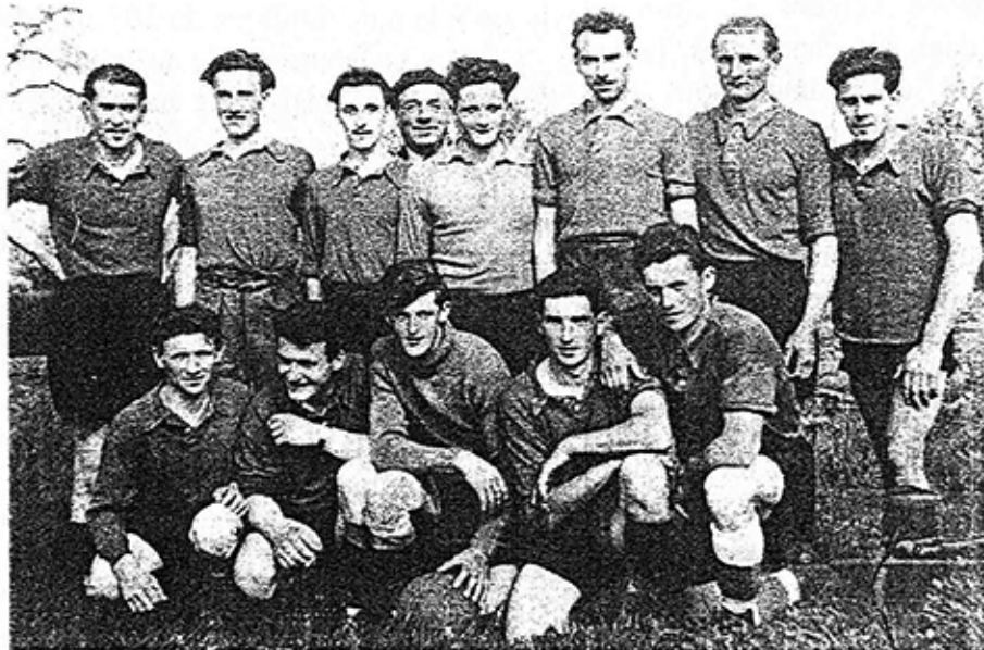
Equipe de Foot de Brinon en 1960

Mais non, je pense qu'ils avaient tout simplement plus de tripes et moins de BLA. BLA